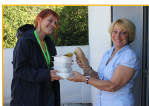
LIVRAISON DE REPAS

Notre service handicap accompagne les personnes en situation de handicap dans les actes essentiels de la vie quotidienne (aide au lever, aide à l'alimentation,...) mais aussi à la vie sociale (promenades, loisirs,...) en veillant à préserver leur autonomie.